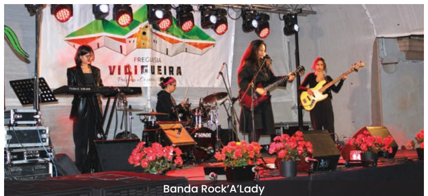
Banda Rock' A' Lady