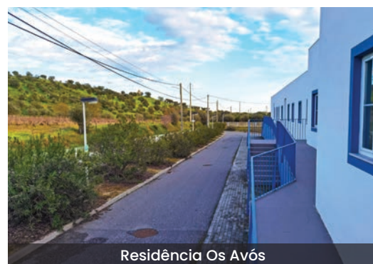
Residência Os Avós

A Residência é uma Estrutura Residencial para Pessoas Idosas (ERPI) da Fundação Domingos Simão Pulido que assegura uma resposta social importante para a comunidade.