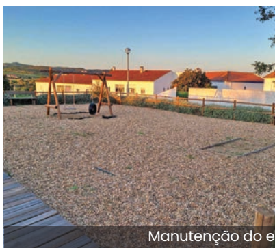
Manutenção do espaço Miramendro

Consciente que a limpeza e a manutenção dos espaços públicos são fundamentais para que a população possa usufruir dos mesmos, a Junta de Freguesia de Vidigueira procedeu nos últimos meses, através de contratação de serviço, a uma intervenção nos espaços que são sua responsabilidade, nomeadamente, o espaço Miramendro e a área envolvente da Ermida de São Pedro.