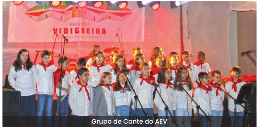
Grupo de Cante do AEV

Passados 50 anos da Revolução dos Cravos, a Junta de Freguesia de Vidigueira reafirma, na sua atividade de todos os dias, os valores do 25 de Abril, dando voz a uma das suas conquistas: o Poder Local Democrático.