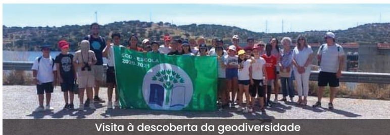
Visita à descoberta da geodiversidade