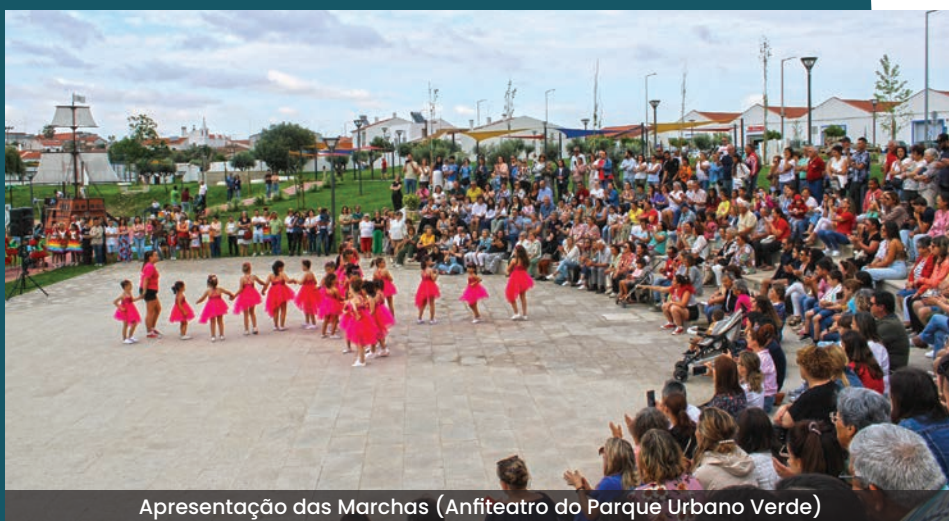
Apresentação das Marchas (Anfiteatro do Parque Urbano Verde)

Foi no dia 8 de junho que as marchas da Freguesia de Vidigueira se apresentaram ao público, dando início à temporada "Santos Populares 2024". Uma iniciativa organizada pela Junta de Freguesia que começou com a concentração das marchas no Largo da Cascata, seguindo-se um desfile pelas ruas da vila até ao Parque Verde Urbano, onde as pessoas encheram por completo o anfiteatro deste novo espaço de lazer.