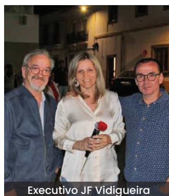
Executivo JF Vidigueira