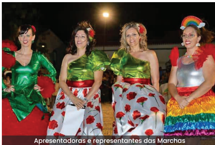
Apresentadoras e representantes das Marchas