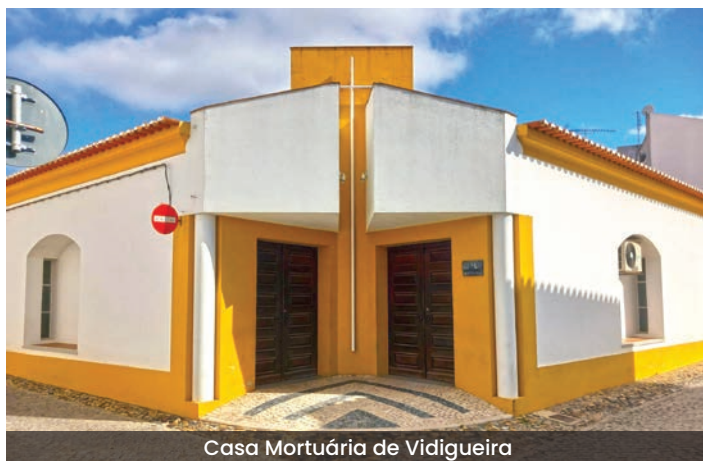
Casa Mortuária de Vidigueira