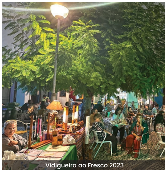
Vidigueira ao Fresco 2023