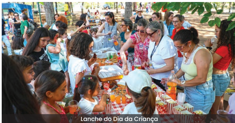
Lanche do Dia da Criança

O Festival Vidigueira Kids é uma iniciativa promovida pelo Município de Vidigueira para comemorar o Dia Mundial da Criança, que este ano aconteceu de 31 de maio a 2 de junho, e encheu de animação a mata das Piscinas Municipais Carlos Goes com um programa de atividades diversificado direcionado aos mais pequenos.