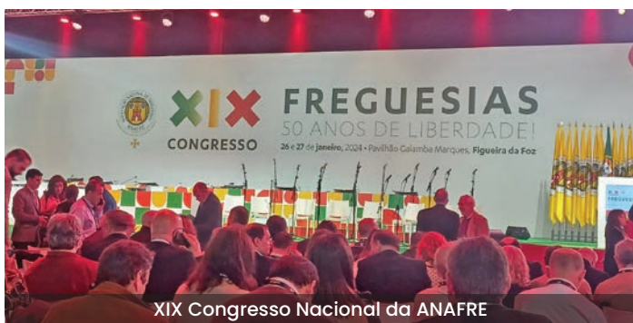
XIX Congresso Nacional da ANAFRE

A participação dos órgãos da Freguesia prende-se com a necessidade de obter a informação que possa contribuir para um melhor desempenho dos mesmos, aproveitando o trabalho da ANAFRE, que todos os dias trabalha pela valorização e afirmação das Juntas de Freguesia na administração pública.