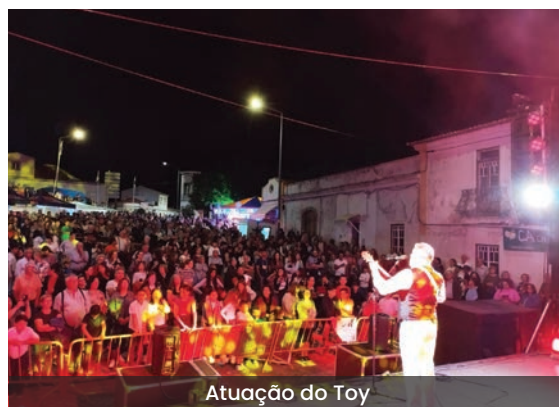
Atuação do Toy

A festa foi organizada pelo Clube de Futebol Vasco da Gama de Vidigueira, ao qual a Junta de Freguesia expressa o seu agradecimento pela disponibilidade em continuar a assumir essa tarefa.