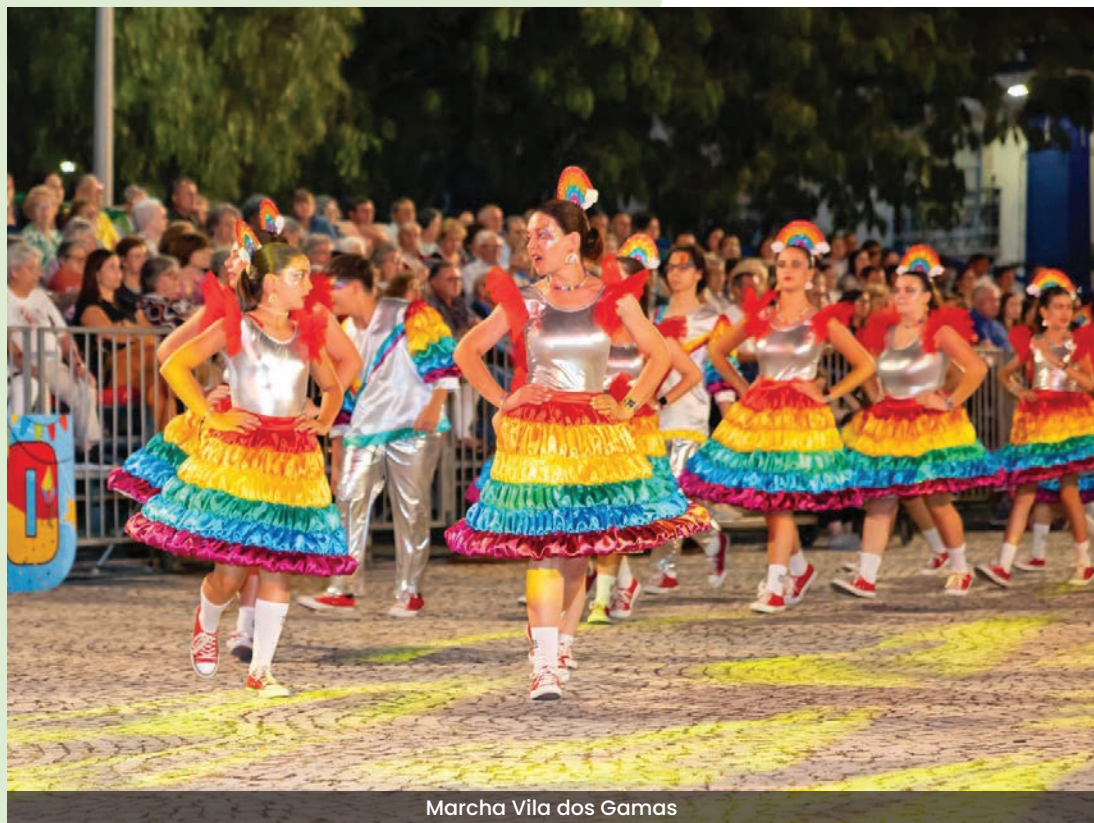
Marcha Vila dos Gamas

É uma das iniciativas populares mais acarinhadas de Vidigueira que resulta do dinamismo de pessoas e entidades. Um momento, em que a Junta de Freguesia se empenha para que as coisas aconteçam. E este ano não foi exceção, as marchas saíram à rua e o arraial foi uma festa.