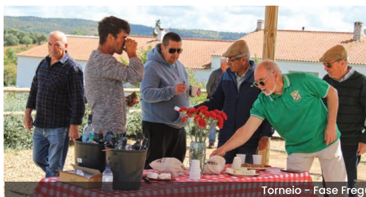
Torneio - Fase Freguesia de Vidigueira