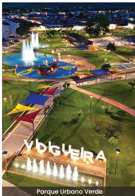
Parque Urbano Verde

Reconhecendo a importância desta obra na requalificação urbana, um contributo para a qualidade de vida dos vidigueirenses, o executivo da Junta de Freguesia e a Presidente da Assembleia de Freguesia de Vidigueira marcaram presença na cerimónia de inauguração do Parque Urbano Verde e parabenizaram o Município, na pessoa do Sr. Presidente Rui Raposo, pela obra realizada, um investimento de 2,6 milhões €, cofinanciada pelo Alentejo 2020 (FEDER).