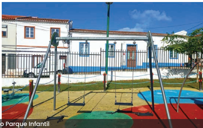
Conservação do Parque Infantil