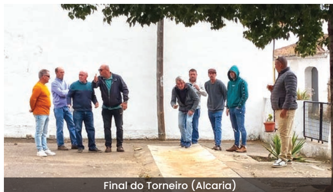
Final do Torneio (Alcaria)

Uma iniciativa que pretende estimular a prática de um jogo popular de tradição local, onde o convívio e o companheirismo são indispensáveis, o que voltou a acontecer, tendo o torneio sido um bom momento de confraternização e parceria institucional entre Juntas de Freguesia, que felicitam todos os participantes.