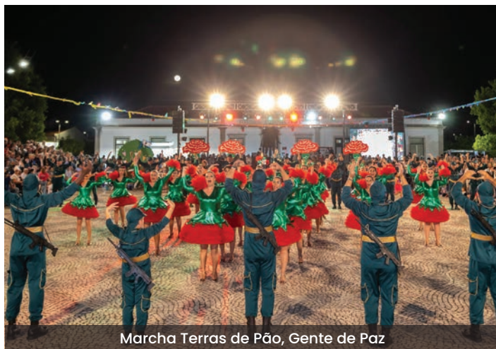
Marcha Terras de Pão, Gente de Paz

Nesta edição, participaram a Marcha Infantil de Vidigueira, a Marcha da Vidigueira - Vila dos Gamas, a Marcha Terras de Pão, Gente de Paz, a Marcha da Freguesia de Portel, a Marcha Popular da Casa do Povo de Nossa Sra. de Machede – Évora, a Marcha da União Desportiva e Cultural Banheirense e a Marcha da Penha de França, num total de 295 marchantes.