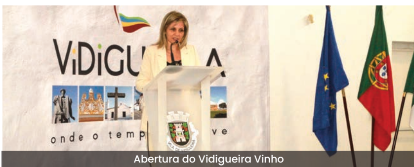
Abertura do Vidigueira Vinho

A Junta de Freguesia marcou presença no Vidigueira Vinho, integrando o stand institucional das Juntas de Freguesia do concelho, onde promoveu o território e a sua atividade, havendo lugar à distribuição de merchandising aos visitantes, e aproveitou para divulgar o Arraial Popular 2024.