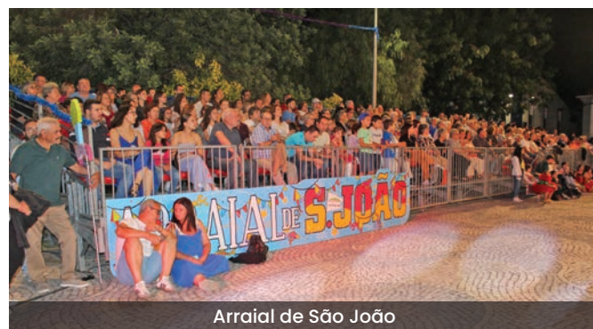
Arraial de São João

A noite começou com um desfile pelas ruas da vila, a que se seguiu a atuação na praça, iniciada pela Marcha Infantil da Vidigueira, lembrando que, passada uma década da sua criação, foi aí que muitos vidigueirenses começaram a sua participação nas marchas. Durante quase três horas, com transmissão em direto no Facebook para aqueles que, por algum motivo, não puderam estar presentes, as marchas animaram o povo que saiu à rua, passando as suas mensagens e a alegria contagiante que as caracterizam. Houve ainda oportunidade para exibir um filme que fez uma retrospectiva dos 11 anos desta atividade na Vidigueira e deixar o desejo de que as marchas das outras freguesias do concelho possam estar de regresso no próximo ano.