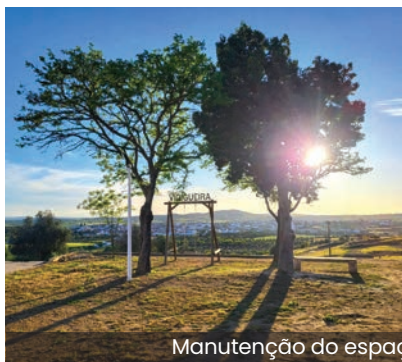
Manutenção do espaço Ermida de São Pedro