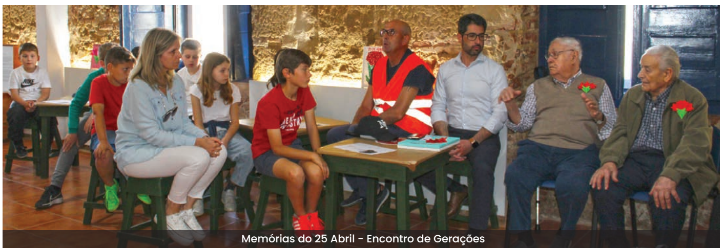
Memórias do 25 Abril – Encontro de Gerações

Um momento que também foi de afeto, que terminou com a interpretação da “Grândola Vila Morena” cantada por gerações diferentes a uma só voz.