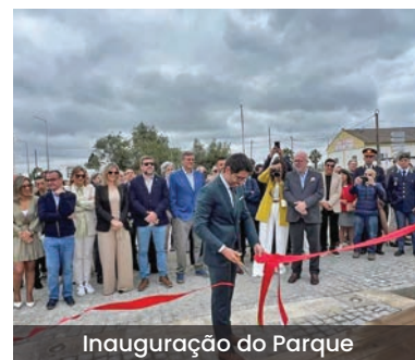
Inauguração do Parque