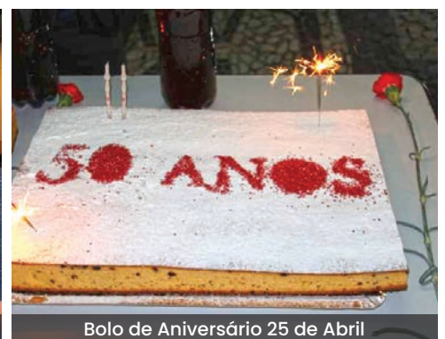
Bolo de Aniversário 25 de Abril