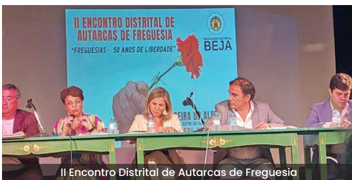
II Encontro Distrital de Autarcas de Freguesia