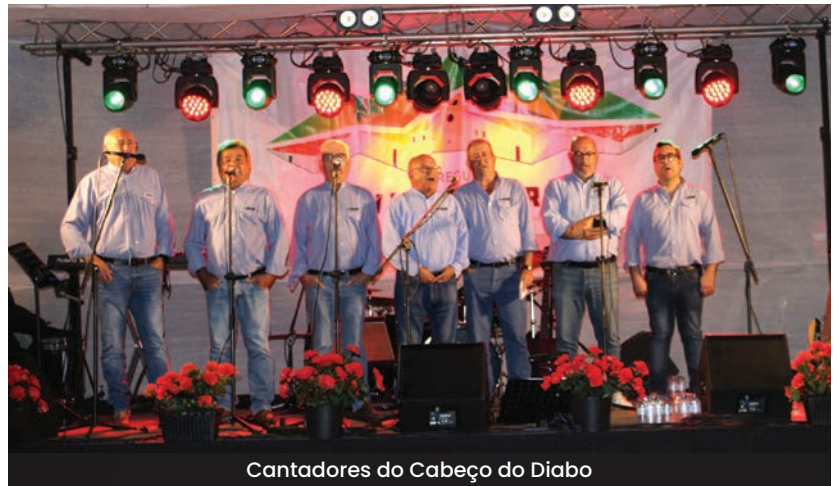
Cantadores do Cabeço do Diabo